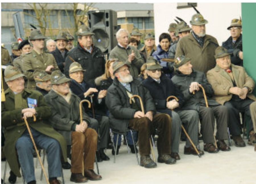
Alcuni reduci durante la cerimonia alla Scuola Nikolajewka.

CELEBRATO A BRESCIA IL 71° DELLA STORICA BATTAGLIA