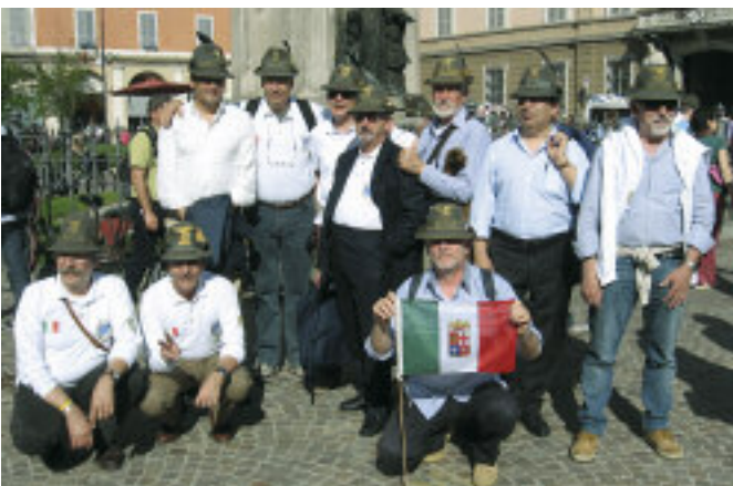
Foto di gruppo di allievi dell'89° corso AUC che si erano dati appuntamento all'Adunata di Piacenza.