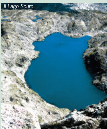
Il Lago Scurio.

Dalla Capanna Presena, si sale al Passo Castellaccio (2.963 m) dove si incontrano ancora rotoli di filo spinato. Qui inizia il percorso che con attrezzature, passerelle sospese, passaggi esposti, ripidi canaloni e una galleria di 67 metri scavata nel granito