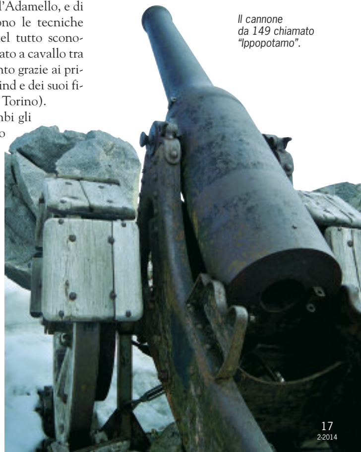
Il cannone da 149 chiamato "Ippopotamo".

di notte per nascondere al nemico, e aveva una gittata di nove chilometri (fu il pezzo di medio calibro posizionato più in alto su tutti i fronti europei). Restaurato da volontari alpini, cimelio della Grande Guerra, venne lasciato nella sua posizione di combattimento come monumento e monito. Ma è questo, la Cresta della Croce, anche il luogo che ricalca le prime storiche tracce di escursione alpinistica con la quale nel 1864 Julius Payer iniziò l'esplorazione del Gruppo dell'Adamello e dove stando al suo racconto una piccola croce di legno a 3.330 metri già esisteva prima della sua visita, a ricordare sembra un pastore morto sulla Vedretta del Mandrone. Gli uomini, tutti gli uomini da entrambe le parti, soffrirono pene inaudite, per altri due inverni. E lassù, ai tremila metri, con otto mesi a temperature tra i -10^{\circ} e i -15^{\circ} C (e punte a -25^{\circ} ) e con neve alta fino a 12 metri di media, riuscire a non morire era già una vittoria. Il primo novembre del 1918 le truppe italiane discesero in Val Vermiglio dal Tonale, senza trovare resistenza. Era la fine del conflitto. L'Adamello dopo quattro anni, riconquistò il silenzio delle vette e dei ghiacci.