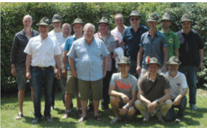
Alpini del coro brigata Cadore, nel 1986, dopo 26 anni, al raduno del Triveneto a Schio.