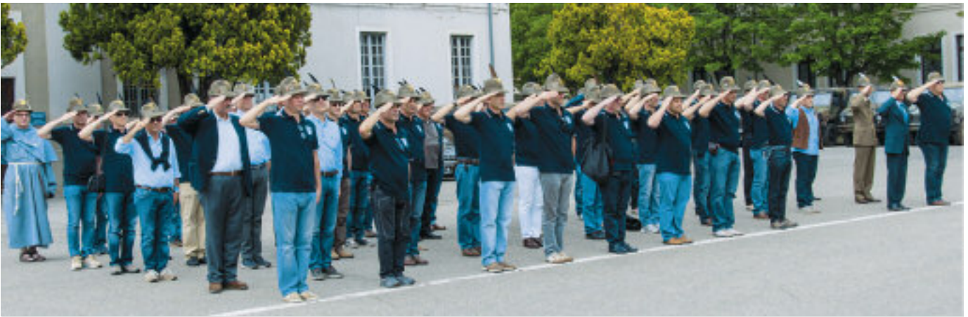
Tre giorni di festeggiamenti per il raduno degli alpini del 110° AUC a trent'anni dalla prima nomina, alla caserma Cesare Battisti con l'allora capitano, oggi generale, Biagio Abrate.