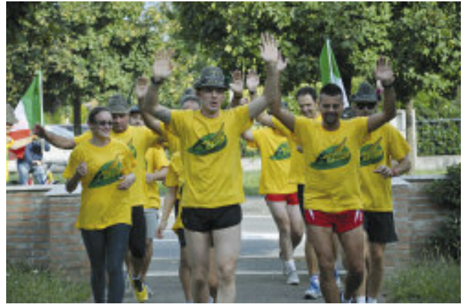
Sopra: gli alpini del Gruppo sul monte Trabucco e all'arrivo della "Staffetta dell'amicizia".