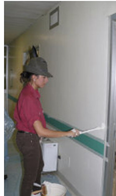
La squadra dei decoratori con i medici dell'ospedale e una giovane della Sezione intenta a tinteggiare.

O ttantacinque volontari tra alpini della sezione di Torino e dipendenti del corriere espresso “DHL”, coordinati dalla Fondazione “F.O.R.M.A.” onlus, sono stati protagonisti di un intervento di riqualificazione di alcune aree dell’ospedale infantile Regina Margherita di Torino. È stata una giornata all’insegna del volontariato, in cui gli alpini della sezione di Torino, i giovani del 1° raggruppamento e i volontari di DHL che hanno aderito al loro “Global Volunteer Day”, hanno unito le forze per ritinteggiare i 1.400 metri quadri che ospiteranno i reparti dove si svolgeranno le attività ambulatoriali di psicologia legate a patologie oncologiche.