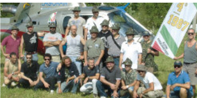
Annuale incontro degli alpini paracadutisti del 4°/1987.