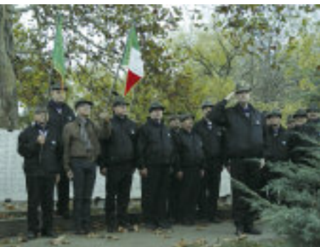
Il coro "Voci del bosco" e i gagliardetti del gruppo Ungheria e Giavera del Montello durante una cerimonia in onore dei Caduti.