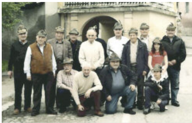
Si ritrovano da 22 anni gli artiglieri alpini classe 1938. Eccoli posare ancora una volta per la foto ricordo.