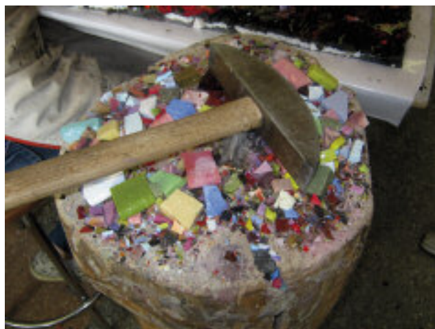
La preparazione del mosaico.

L a gran parte dei vini sulle nostre tavole e in quelle del resto del mondo. Oppure gli idromassaggi che spopolano nelle lussuose dimore dello star system hollywoodiano. Ma anche le “Ferrari” dei pianoforti, utilizzati dai più grandi musicisti, o ancora uno dei primi campioni del mondo di boxe che ha fatto sognare una nazione nel periodo della seconda guerra mondiale. Che cos'hanno in comune tra loro tutte queste cose? Semplice: l'origine in provincia di Pordenone. Barbatelle, vasche Jacuzzi, pianoforti Fazioli e il “gigante buono” Primo Carnera sono prodotti, marchi e uomini che hanno origine nella Destra Tagliamento (così viene anche chiamato il territorio provinciale pordenonese) che rendono questa zona del Friuli Venezia Giulia una eccellenza in Italia e nel mondo. Pordenone e la sua area circostante sono relativamente giovani, visto che è solo nel 1968 che lo Stato riconosce a questo territorio lo status di Provincia.