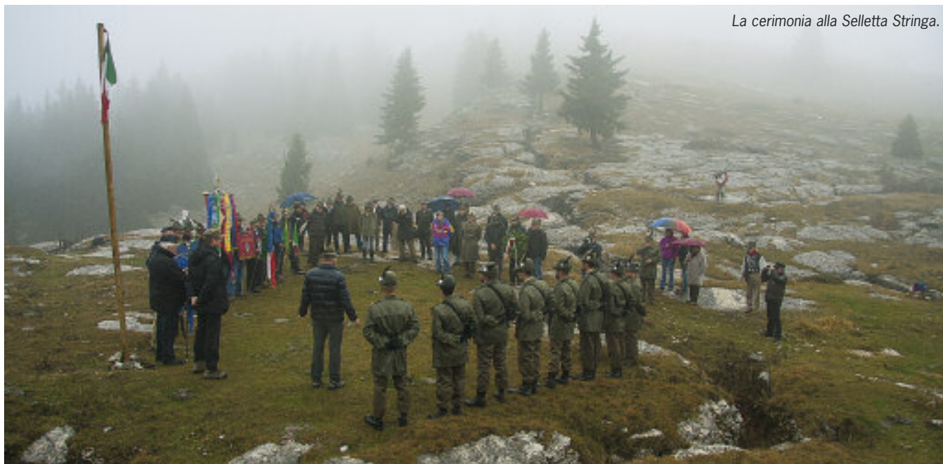
La cerimonia alla Selletta Stringa.

G li alpini di Foza hanno celebrato l'85° anniversario di fondazione con alcuni importanti appuntamenti di carattere storico. Alla presenza di una rappresentanza del 5° reggimento Alpini, guidata dal col. Michele Biasiutti comandante del reggimento, è stata deposta una corona di fiori alla Selletta Stringa – Melette di Foza – in onore del col. Oreste Pirio Stringa, a cui è stato intitolato il Gruppo. Alla cerimonia ha partecipato anche un nipote dell'ufficiale che nel giugno 1916, al comando dei battaglioni alpini Morbegno, Monviso, Val Maira ed Argentera, contribuì ad arrestare la Strafexpedition austro-ungarica su quella parte di altopiano.