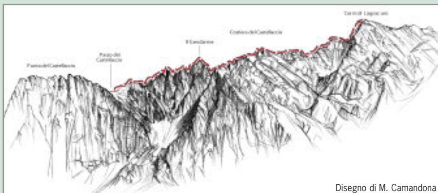
Disegno di M. Camandona

del Gendarme di Casamadre porta al Passo di Casamadre (2.984 m), dove si trovano i ruderi di baracche militari. Un'ultima salita su sfasciumi e si arriva sulla cima del Corno di Lagoscuro (3.166 m). Appena sotto la cima c'è la Capanna Faustinelli-Amici della Montagna (3.160 m) ricavata dalla ristrutturazione di una delle baracche che costituivano un vero e proprio villaggio militare d'alta quota. Il bivacco è normalmente chiuso, ma è possibile usufruire di un annesso locale d'emergenza. Dalla cima si scende in direzione del Ghiacciaio Presena (catene). Arrivati al ghiacciaio ci si dirige verso la Capanna Presena.