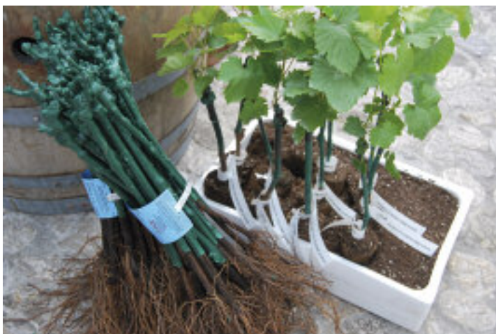
Alcune piantine di barbatelle pronte per la piantumazione e altre già germogliate.