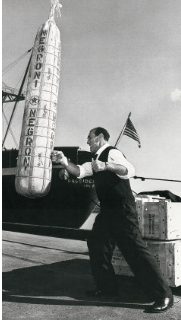
Allenamento speciale per Primo Carnera che scherza con una gigantesca forma di salame italiano, appena scaricata in un porto statunitense.

LAME D'AUTORE - In passato i salti d'acqua, dovuti alla presenza di fiumi nella zona, vennero utilizzati nel manighese per muovere mulini e far funzionare i battiferri nelle officine. Opifici artigianali, in cui i fabbri - con grossi magli - forgiavano arnesi da lavoro soprattutto per contadini e boscaioli ma anche armi di qualità. L'antica tradizione si è tramandata nei secoli e ancora oggi viene portata avanti con moderne tecnologie. Ora le lame forgiate sono frutto di una attenta ricerca scientifica, impreziosite da contenuti di design sofisticato. Nel distretto industriale manighese vengono prodotti coltelli a lama fissa e richi-