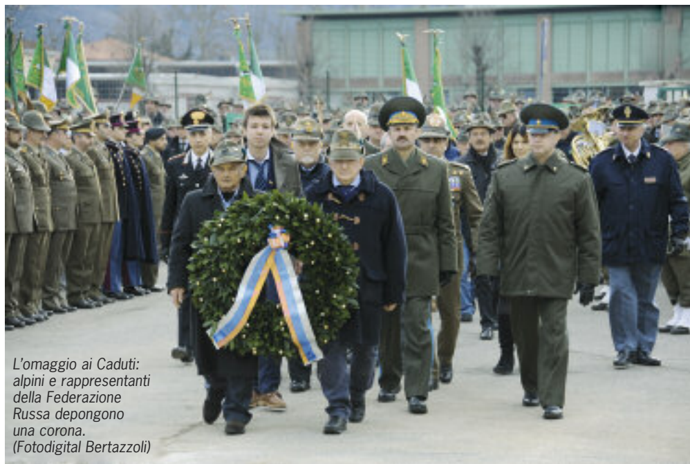
L'omaggio ai Caduti: alpini e rappresentanti della Federazione Russa depongono una corona.

dell'Operazione Sorriso la presentazione del libro “Ritorno a Rossosch” per un doveroso ricordo di un'opera di pacificazione internazionale.