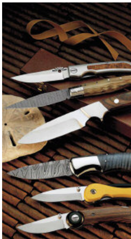
Diversi tipi di coltelli forgiati a Maniago.

dibili, cavatappi, forbici e cesoie, attrezzi manuali da raschio e taglio, utensili da taglio e incisione. La provincia di Pordenone è la prima in Italia per la realizzazione di questo tipo di oggetti, con oltre il 50 per cento della produzione nazionale. Infine da questa zona provengono anche molte delle armi utilizzate nella cinematografia hollywoodiana dedicata alle saghe epiche, quali la spada di Brave Heart oppure quella di Robin Hood, film interpretati rispettivamente da Mel Gibson e Kevin Costner.